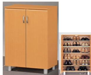
シューズボックス