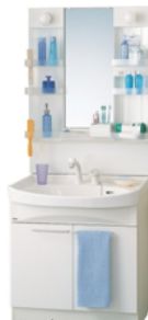
シャンプードレッサー