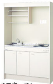
ミニキッチン (1ロガスコンロ付)