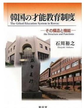
「韓国の才能教育制度 —その構造と機能—」 東信堂