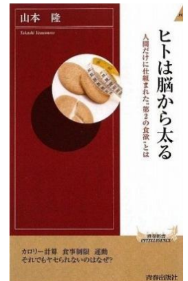
「ヒトは脳から太る」 青春新書