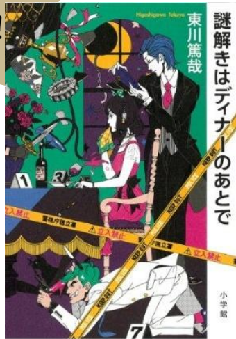
『謎解きはディナーのあとで』 東川篤哉 小学館

ミステリー本として読むと、ちょっと物足りないかもしれませんが、お嬢様刑事と「ごぞいます」口調ながらも毒舌な執事の掛け合いが面白く、普段あまり本を読まない人でもサクサク読み進めることができます。今秋、ドラマ化されますので、その前にぜひ。