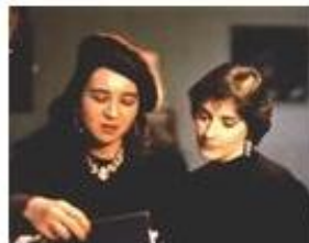
鶴岡 真弓 / エンヤ (ケルト美術研究者) (歌手)