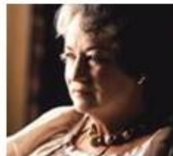
ダフニー・シェルドリッック (動物保護活動家)