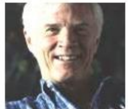
ラッセル・シュワイカート (元宇宙飛行士)