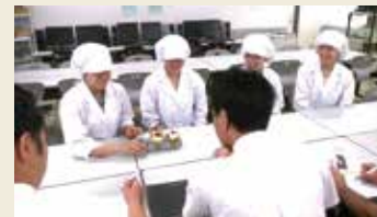
試作レシピ検討会